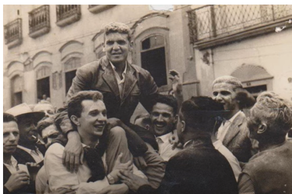
Registro da festa da vitória da campanha na Praça da Matriz

Conhecido no futebol como “Enxadão”, seu apelido serviu de nome a uma equipe fundada com o objetivo de auxiliar a divulgação do então jovem candidato na cidade, o Enxadão Futebol Clube. A aclamação popular não demoraria a alçá-lo à Prefeitura: em 1960, com o lendário Vasco Barioni como vice-prefeito (esclareça-se que prefeito e vice-prefeito concorriam aos seus respectivos cargos separadamente), obteve 2.929 votos em seu primeiro mandato, superando Abel de Almeida (2.200 votos) e Benedito de Góes, o Nenê da Farmácia (1.708 votos).